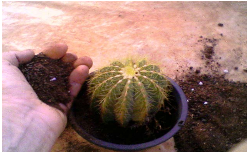
Pressionar para a muda ficar firme.