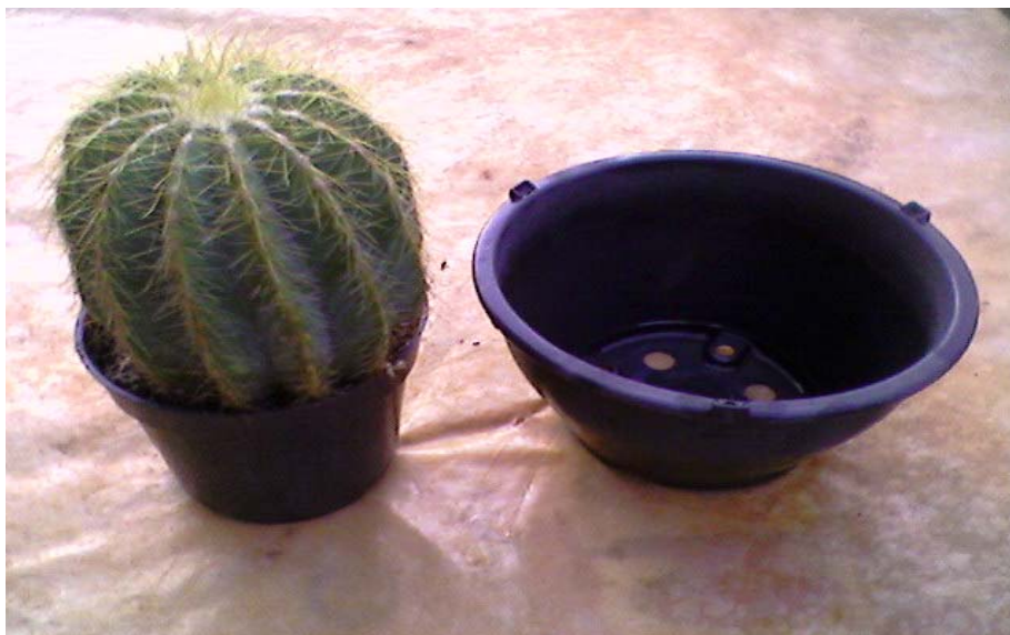
1- Como se observa o vaso está pequeno – replantar num vaso maior.